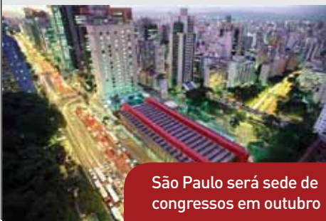
São Paulo será sede de congressos em outubro

Em breve, o Sindicato disponibilizará um hot site exclusivo com informações detalhadas da programação e sobre como participar. São esperados cerca de 250 congressistas, sendo a maioria executivos, profissionais e dirigentes de entidades do setor de serviços, gestores de RH e autoridades nacionais. Aguarde!