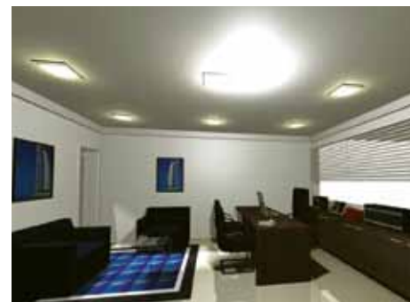
Projeto moderno agrega maior eficiência à sede do Sindicato

Entre as novidades estão a ampliação do auditório, criação de mais salas para treinamento, mudança do sistema de telefonia e informática, aquisição de móveis novos e a implantação de plataforma para cursos online e videoconferência.